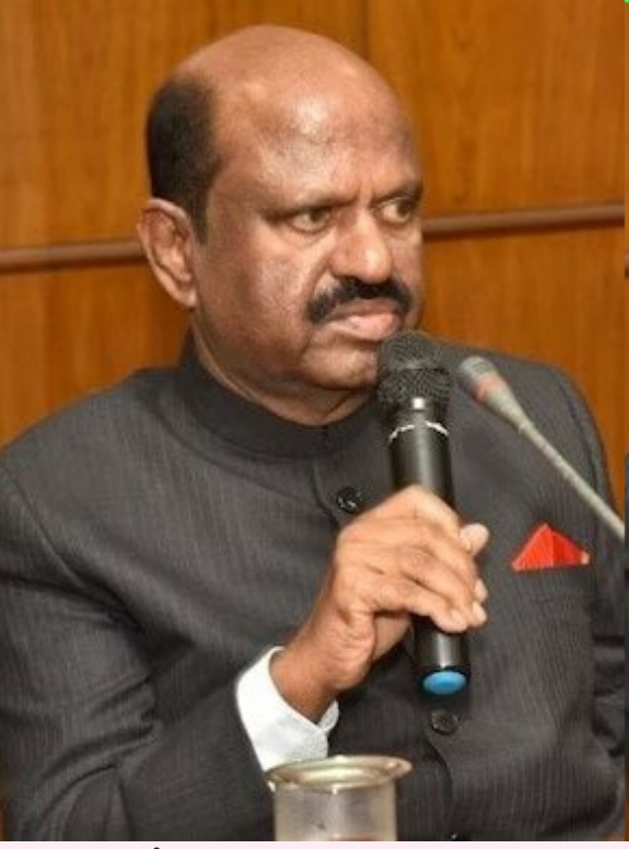
బెంగాల్ అసెంబ్లీ ఎన్నికలకు రంగం సిద్ధమవుతున్న తరుణంలో ఆనంద బోస్ నిష్క్రమణ ప్రాధాన్యత సంతరించుకుంది. రాజ్యాంగ బద్ధమైన పదవీలో ఉంటూనే రాజకీయంగా తీవ్ర విమర్శలు ఎదుర్కోవడం, మరోవైపు కేంద్రం పంపే కొత్త గవర్నర్ ఎవరనే దానిపై ఇప్పుడు సర్వత్రా ఉత్సాహం నెలకొంది. మమతా బెనర్జీ ప్రభుత్వంపై నిరంతరం ఒత్తిడి పెంచుతూ వచ్చిన ఆనంద బోస్, పదవీకి దూరమవ్వడం టీఎంసీకి కొంత ఊరటనిచ్చే అంశమైనప్పటికీ, ఎన్నికల వ్యూహంలో ఇది ఎలాంటి ప్రభావం చూపుతుందో చూడాలి.

కోల్ కత్తా, మార్చి 6, పశ్చిమ బెంగాల్ గవర్నర్ సి.వి. ఆనంద బోస్ గురువారం తన పదవీకి రాజీనామా చేశారు. ఢిల్లీ పర్యటనలో ఉన్న ఆయన, రాష్ట్రపతికి తన రాజీనామా లేఖను సమర్పించారు. 2022 నవంబర్లో బాధ్యతలు చేపట్టిన ఆయన, సుమారు మూడున్నరేళ్ల పాటు పదవీలో కొనసాగారు. రాజీనామా ఆనంతరం ఆయన స్పందిస్తూ, గవర్నర్ కార్యాలయంలో నేను తగినంత సమయం గడిపాను అని క్షుప్తంగా వ్యాఖ్యానించారు. అయితే, రాష్ట్రంలో త్వరలో జరగనున్న అసెంబ్లీ ఎన్నికల తరుణంలో ఈ నిర్ణయం తీసుకోవడం వెనుక లోతైన రాజకీయ కారణాలు ఉన్నాయని విశ్లేషకులు భావిస్తున్నారు. ఆనంద బోస్ పదవీకాలం మొదటి నుంచి అధికార తృణమూల్ కాంగ్రెస్ విభేదాలతోనే సాగింది. ముఖ్యంగా యూనివర్సిటీల వైస్ ఛాన్సలర్ల నియామకం, రాష్ట్ర ఆవిర్భావ దినోత్సవ వేడుకలు, పంచాయతీ ఎన్నికల హింస వంటి అంశాలపై ముఖ్యమంత్రి మమతా బెనర్జీతో ఆయన నేరుగా తలపడ్డారు. ప్రభుత్వం పంపిన పలు బిల్లులను పక్కన పెట్టడం ద్వారా ఆయన రాజీభవనను ఒక సమాంతర ప్రభుత్వం లా నడుపుతున్నారని టీఎంసీ నేతలు తీవ్రంగా విమర్శించారు. ఈ క్రమంలో మమతా బెనర్జీపై ఆయన పరువు నష్టం దాచా కూడా వేయడం రాజకీయంగా పెను దుమారం రేపింది. ఆనంద బోస్ పదవీలో ఉండగానే అత్యంత వివాదాస్పదమైన లైంగిక వేధింపుల ఆరోపణలను ఎదుర్కోవాల్సి వచ్చింది. 2024 మే నెలలో రాజీభవనం చెందిన ఓ తాత్కాలిక మహిళా ఉద్యోగిని, గవర్నర్ తనను వేధించారని కోల్కతా పోలీసులకు ఫిర్యాదు చేయడం దేశవ్యాప్తంగా చర్చనీయాంశమైంది. ఈ ఘటనపై మమతా బెనర్జీ స్పందిస్తూ, రాజీభవనలో మహిళలకు భద్రత లేదు అని ఘాటుగా విమర్శించారు. దీనికి ప్రతిగా గవర్నర్ తన నిజాయితీని నిరూపించుకోవడానికి రాజీభవన సీసీటీవీ వుల్ జేసి బహిరంగంగా ప్రకటించి ఆరోపణలను ఖండించినప్పటికీ, ఆ మచ్చ ఆయన పదవీకాలాన్ని వెంటాడింది.